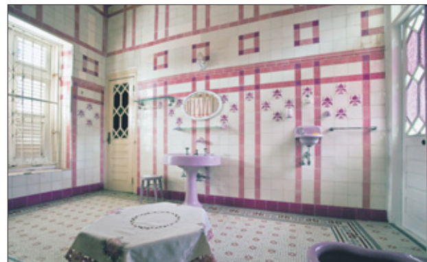
De roze met witte badkamer van Scharlooeweg 7. 'Het oog van de architect heeft een grotere invloed dan dat van de fotograaf.'

In de toekomst hoort Sinaya haar werk nog verder te accentueren naar verschillende sociale boeken en lagen van de maatschappij, ook buiten Curaçao. Het volgende uitdagende project op Curaçao voor 2011 is al in volle gang.