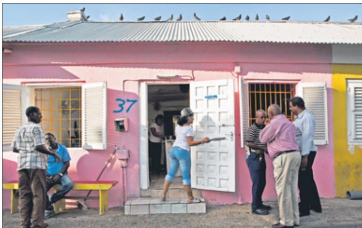
Bij Scharloo Abou en Fleur de Marie overheersen de mensen.

Concept, fotografie, productie, tekst Sinaya Wolfert -2010- Tekst Jeannette van Ditzhuijzen ISBN: 978-90-81098-3-7