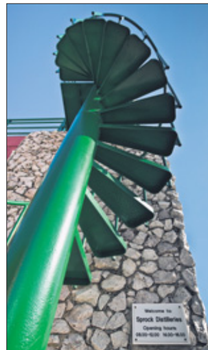
Wat het eerst opvalt bij de foto's zijn de kleuren, zoals de groene trap die hoog opklimt tegen de blauwe lucht van Sprock Distilleries.

Mensen met al hun gezichten, houdingen, uitdrukkingen en emoties vormen de kern van het werk van Sinaya. De werk- en leefomgeving, de straat, de mens en het sociale contact vormen daarbij de achtergrond voor haar documentaire en reportages.